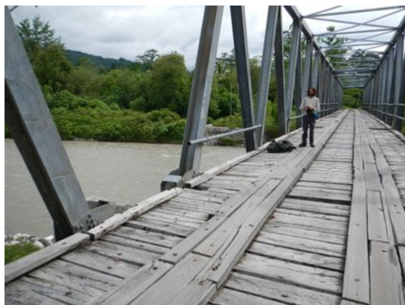
Questo il Sapalewa come si presentava all'altezza del ponte il mese scorso